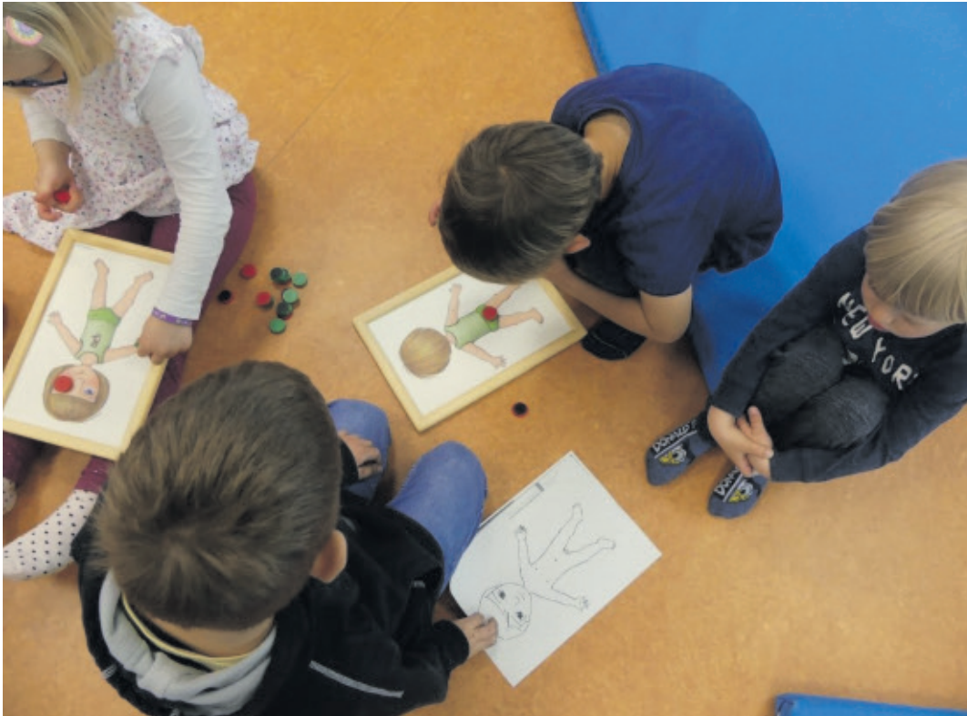
Klare Willensäußerung: Kinder zeichnen, wo sie nicht angefasst werden möchten

Demokratie will gelernt und geübt sein – am besten fängt man möglichst früh an. Die AWO lebt das schon in ihren Kitas. Wie man das machen kann, war Gegenstand von zwei Fachtagungen, an denen die Einrichtungsleitungen zum Thema „Mitentscheiden und Mithandeln in der Kita“ gearbeitet haben.