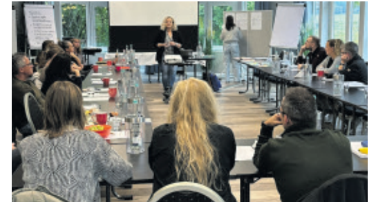
In Fortbildungen werden Demokratie und Teilhabe thematisiert.

Auch fachlich macht dieser Ansatz Sinn. Denn Mitbestimmung in der Kita bildet das Fundament für Demokratie, Erziehung und Bildung: „Demokratie ist die einzige politisch verfasste Gesellschaftsordnung, die gelernt werden muss – immer wieder, tagtäglich und bis ins hohe Alter hinein.“