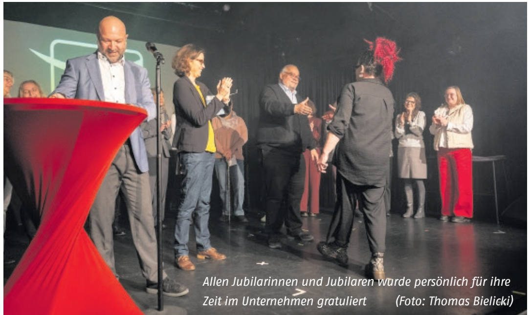
Allen Jubilarinnen und Jubilaren wurde persönlich für ihre Zeit im Unternehmen gratuliert