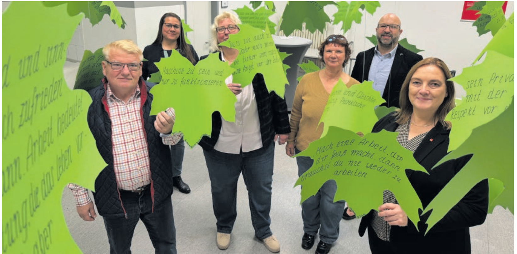
Im Blätterwald: Auf den Blättern stehen die Stimmen von Ratsuchenden der Beratungsstelle Arbeit.

rin Torlach. „Sie wissen, dass sie austauschbar sind – und dass die Würde des Menschen am Arbeitsplatz oft die erste ist, die auf der Strecke bleibt.“